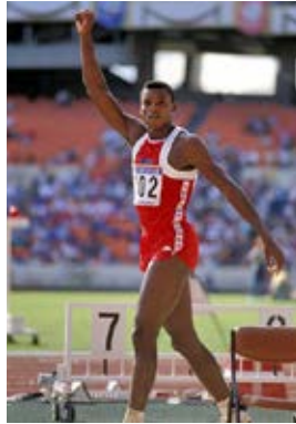
Carl Lewis (États-Unis), Séoul, 1988.