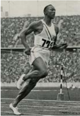
Jesse Owens (États-Unis), 200 m, Berlin, 1936.