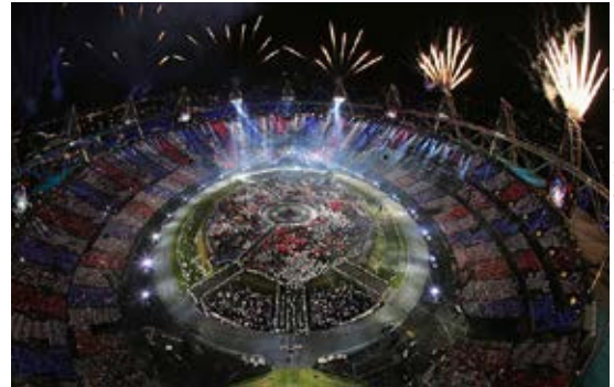
Cérémonie d'ouverture, Londres, 2012.