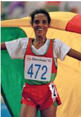
Derartu Tulu, Barcelone, 1992.