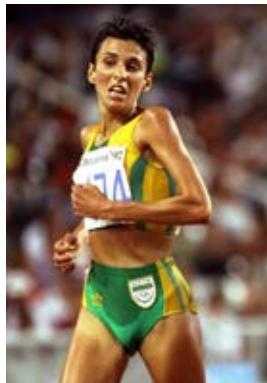
Elana Meyer, Gateshead, 1992.