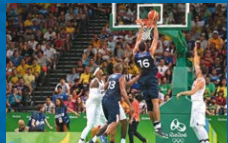
Match de basket-ball France-États-Unis. Jeux de Rio, photographie de Jesse D. Carrabranti, 2016.

Le basketball fait son apparition aux Jeux Olympiques de 1904 à Saint-Louis comme sport de démonstration. C'est aux Jeux Olympiques de 1936 à Berlin qu'il rejoint le programme officiel. Les États-Unis ont dominé le basketball international et remportent tous les titres olympiques, jusqu'à la victoire des Soviétiques aux Jeux Olympiques de Munich en 1972. En 2016, aux Jeux Olympiques de Rio, les États-Unis enregistrent leur quinzième victoire (la troisième d'affilée depuis 2008) et sont favoris devant les Espagnols et les Serbes pour 2024.