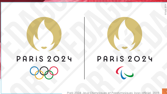
Paris 2024. Jeux Olympiques et Paralympiques. logo officiel, 2019.

INTERDICTION D'IMPRIMER L'EXPOSITION par quelque procédé que ce soit sans l'accord express de la CASDEN.