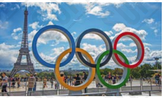
Les anneaux Olympiques célèbrent Paris comme ville hôte des JO 2024, photographie de Nicolas Briquet, 2017.