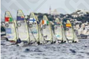
Seiko 49er et 49erFX aux championnats du monde à Marseille, photographie de Christophe Launay, 2013.

En outre, 70 % des sites accueillant les compétitions sont déjà construits et 25 % sont imaginés comme temporaires. La France va aussi accueillir pour la première fois de son histoire les Jeux Paralympiques. Ces épreuves devraient rassembler 4.350 athlètes de 182 nations différentes sur plusieurs sites sportifs.