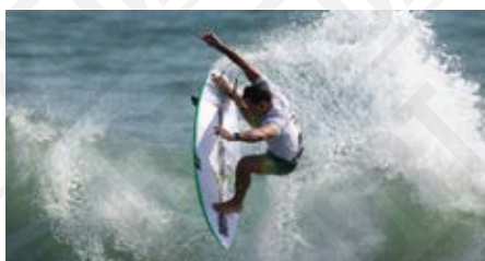
Le surfeur Julian Wilson (Australie) lors de la manche 1 masculine aux Jeux Olympiques de Tokyo 2020, photographie de Ryan Piense, 2021.

Le surf apparaît pour la première fois aux Jeux Olympiques de Tokyo 2020, comme sport additionnel. Originaire de l'océan Pacifique, cette pratique séculaire à Hawaï s'est largement popularisée à travers le monde au fil du XX e siècle. Duke Kahanamoku, nageur aux cinq médailles olympiques (1912, 1920 et 1924) originaire d'Honolulu, popularise ce sport à grande échelle. Le surf sera également au programme de Paris 2024, sur le site polynésien de Tahiti.