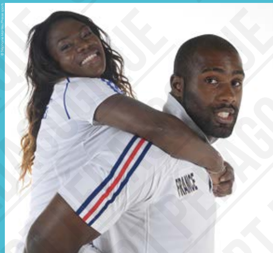
Clarisse Agbegnenou et Teddy Riner (France), médaillés d'or aux championnats du monde de judo, 2014.

À l'origine, les planches de surf étaient taillées dans un tronç d'arbre. Elles sont aujourd'hui façonnées en résine polyester et fibre de verre. Il existe plusieurs formes permettant différents styles de glisse.