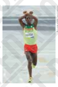
Feysa Lileso (Éthiopie), arrivé deuxième au marathon, croisé ses poings au-dessus de sa tête en soutien aux manifestations contre le gouvernement éthiopien, photographie, 2016.