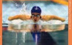
Elie Simmonds [Grande-Bretagne] au 200 mètres quatre nages individuel (classique).

6 Les Jeux Paralympiques à Rio rassemblent 4.328 athlètes de 159 pays. Après le scandale du dopage des athlètes olympiques et paralympiques russes, la délégation entière est bannie des Jeux Paralympiques. L'Anglaise Elie Simmonds brille lors de ces Jeux : elle obtient une médaille d'or au 200 mètres quatre nages en battant le record du monde et une de bronze au 400 mètres nage libre. Elle totalise depuis les débuts de sa carrière paralympique, huit médailles dont cinq en or.