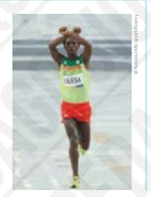
Feyiso Lilesa [Éthiopie], arrivé deuxième au marathon, croise ses poings au-dessus de sa tête en soutien aux manifestations contre le gouvernement éthiopien. photographie, 2016.

6 Les Jeux Paralympiques à Rio rassemblent 4.328 athlètes de 159 pays. Après le scandale du dopage des athlètes olympiques et paralympiques russes, la délégation entière est bannie des Jeux Paralympiques. L'Anglaise Elie Simmonds brille lors de ces Jeux : elle obtient une médaille d'or au 200 mètres quatre nages en battant le record du monde et une de bronze au 400 mètres nage libre. Elle totalise depuis les débuts de sa carrière paralympique, huit médailles dont cinq en or.