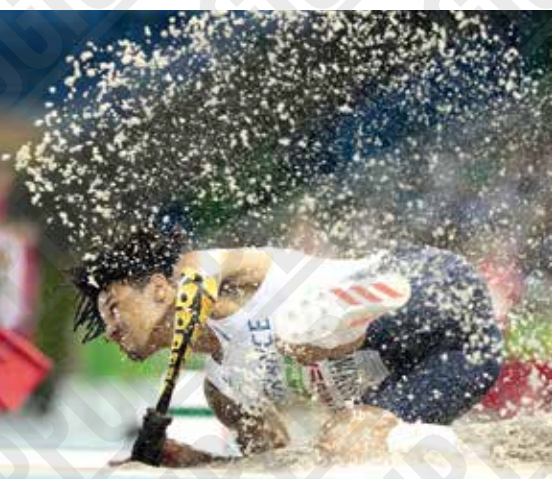
Arnaud Assoumani [France] au saut en longueur, 2016.

Scanner ce QR code pour voir la vidéo sur Arnaud Assoumani