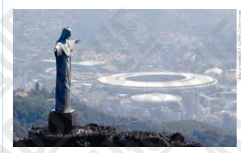
Vue du stade Olympique Maracanã et du Corcovado, 2016.