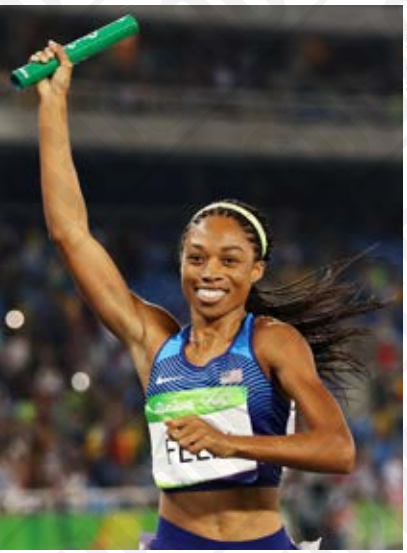
Alyson Felix [États-Unis] après avoir remporté l'or lors du relais 4x400 mètres femmes aux Jeux Olympiques.

Scanner ces QR codes pour voir la vidéo sur Allyson Felix Michael Phelps