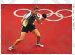
Natalia Partyka (Pologne) au tennis de table, photographie de Lars Baron, 2008.

Outre sa réussite sur le plan de l'organisation, la Chine se hisse à la première place du tableau des médailles devant les États-Unis et la Russie. C'est une première, alors que ces Jeux Olympiques seront ceux des records : 40 records du monde et plus de 130 records olympiques. Si l'incontestable héros des Jeux Olympiques est le coureur Jamaïcain Usain Bolt , le nageur américain Michael Phelps qui remporte huit médailles d'or, fait sensation (entre 2004 et 2016, il totalise le chiffre époustouffant de 23 médailles d'or).