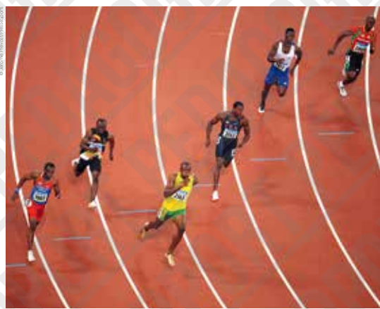
Usain Bolt (Jamaïque) en tête du 200 mètres, photographie de Jérôme Prevost, 2008.

Infrastructure bien visible des piscines extérieures puis intérieures, le plongeon est un objet sportif à part entière. Plateforme de béton à dix mètres, il apparaît sous la forme d'un tremplin souple à trois mètres pour les compétitions.