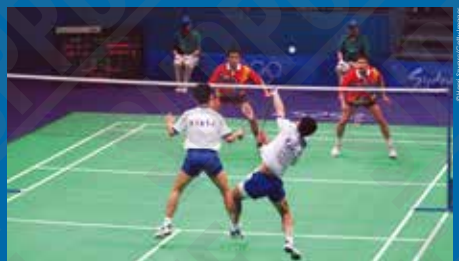
Match de badminton en double. Indonésie (Tony Gunawan, Candra Wijaya) contre Corée (Dong-Soo Lee, Yong-Sung Yoo)

Si l'on trouve des traces en Asie ainsi qu'en Amérique du Nord et du Sud de jeux avec volant, c'est en Inde que le badminton moderne voit le jour. Les officiers britanniques modifient les caractéristiques du jeu « indigène », puis l'importent en Angleterre pour le codifier et l'institutionnaliser en 1873. Il fait ses débuts comme sport de démonstration en 1972 à Munich et entre au programme officiel à Barcelone en 1992, avec des épreuves de simple et de double, hommes et femmes. L'épreuve de double mixte fait son entrée en 1996 à Atlanta.