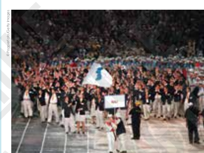
Les Corée du Nord et du Sud défilant unies à la cérémonie d'ouverture

La cérémonie d'ouverture est un hommage à l'histoire de l'Australie et à la culture aborigène, dont Cathy Freeman est le symbole et l'emblème. Avec ses cinq médailles, la sprinteuse américaine Marion Jones est considérée pendant longtemps comme l'autre héroïne de ces Jeux Olympiques de l'hémisphère sud, avant qu'elle ne soit convaincue de dopage, ce qui l'oblige à restituer ses médailles sept ans plus tard.