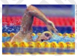
Ian Thorpe (Australie) au 400 mètres nage libre, 2000.