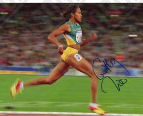
Cathy Freeman (Australie) médaillée d'or au 400 mètres, photographie, 2000.

Scanner ce QR code pour voir la vidéo sur Cathy Freeman