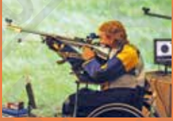
Jonas Jacobsson (Suède) au concours de tir sportif, 1996.

Les Jeux Paralympiques d'Atlanta rassemblent près de 3.808 athlètes venus de 104 pays. Le Comité Paralympique fait face à de graves difficultés de financement, mais grâce à des dons, les Jeux Paralympiques peuvent finalement être organisés. L'une des vedettes des épreuves d'Atlanta est le Suédois Jonas Jacobsson , qui remporte deux médailles d'or et une médaille de bronze au tir à la carabine. Il participe par la suite à plusieurs autres olympiades, neuf au total, remportant au final 17 médailles d'or, deux d'argent et neuf de bronze.