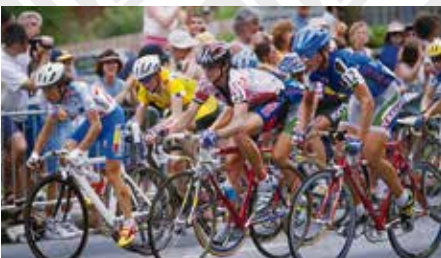
Course de cyclisme sur route, Jeanine Galoy (États-Unis), Alessandra Cappellotto (Italie) et Jeanne Longo-Ciprilli (France), 1996.

Les premières courses de cyclisme sont organisées à partir de 1867 et se multiplient dans les années 1890. Ce sport fait partie du programme des Jeux Olympiques dès 1896 pour les hommes. Le cyclisme sur route décline dans les années 1960-1970 au profit d'une pratique en milieu naturel. Le VTT et le BMX entrent d'ailleurs aux Jeux Olympiques en 1996 et 2008. Les femmes, quant à elles, vivent leurs premières épreuves olympiques à partir de 1984.