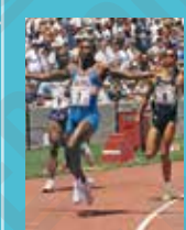
Carl Lewis (États-Unis). La pose du vainqueur, photographie, 1996.

Le choix d'Atlanta, siège de Coca-Cola, pour le centenaire des Jeux Olympiques, à la place d'Athènes, crée la polémique dès 1990. Le rappel de la lutte contre la ségrégation raciale à travers les figures de Martin Luther King ou de Mohamed Ali choisi pour allumer la flamme ne suffit pas à faire oublier les problèmes d'organisation : les transports impossibles, la précarité des volontaires ou l'éviction des sans-abris. En outre, cette olympiade est sous pression après le drame de l'explosion du vol 800 TWA deux jours avant la cérémonie d'ouverture, et l'attaque terroriste contre le village olympique le 27 juillet 1996, qui fait deux morts et 111 blessés.