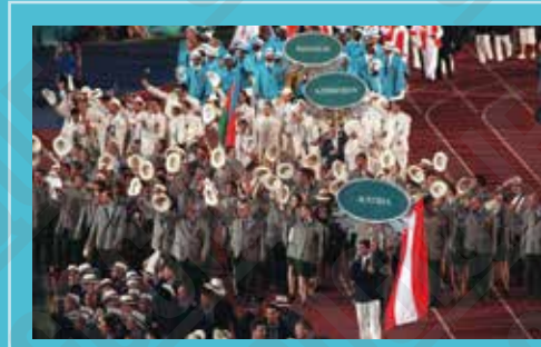
Le défilé des nations lors de la cérémonie d'ouverture, photographie anonyme, 1996.