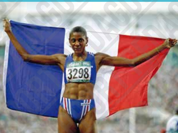
Marie-José Pérec après sa victoire au 400 mètres, 1996.