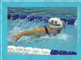
Michelle Smith (Irlande) sur le point de gagner au 400 mètres papillon, 1996.