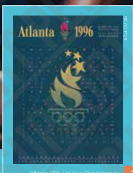
Atlanta 1996. Les Jeux Olympiques du Centenaire, affiche non signée, 1996.