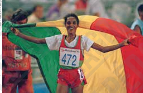
Derartu Tulu (Éthiopie) défilant avec le drapeau de l'Éthiopie après sa victoire, 1992.