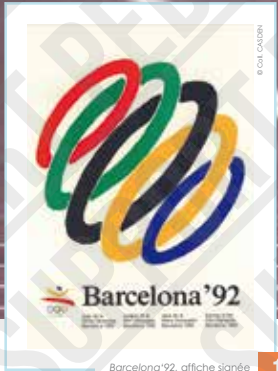
Barcelona '92, affiche signée Josep Pla-Narbona, 1992.