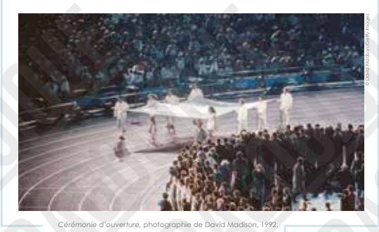
Cérémonie d'ouverture, 1992.