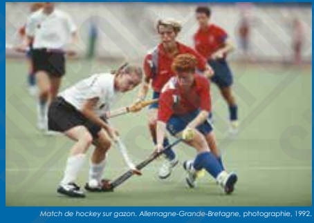
Match de hockey sur gazon, Allemagne-Grande-Bretagne, photographie, 1992.

Le hockey sur gazon apparaît pour la première fois aux Jeux Olympiques de 1908 (puis est définitivement au programme à partir de 1928). La pratique féminine olympique est actée à partir des Jeux Olympiques de 1980. C'est un sport de balle avec une crosse qui se joue en équipe de onze. Le hockey est codifié et institutionnalisé dans la seconde moitié du XIX e siècle. L'équipe indienne de hockey remporte six titres olympiques consécutifs pour un palmarès total de huit médailles d'or.