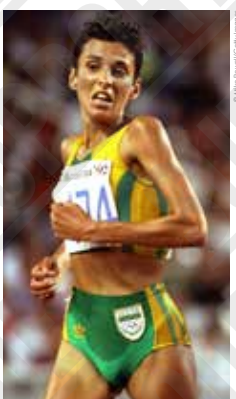
Elana Meyer (Afrique du Sud) lors du 10.000 mètres femmes, photographie de Mike Powell, 1992.

La balle de hockey est sphérique et creuse. Elle pèse entre 156 et 163 grammes. D'abord fabriquée en cuir, elle est désormais composée de matériaux plastiques. Lisse pour les débutants, elle possède des cratères ou alvéoles pour la pratique à haut niveau.