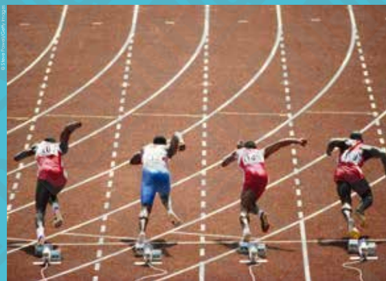
Départ du 100 mètres, Ben Johnson (Canada), Calvin Smith (États-Unis), Linford Christie (Jamaïque) et Carl Lewis (États-Unis) (de droite à gauche), 1988.