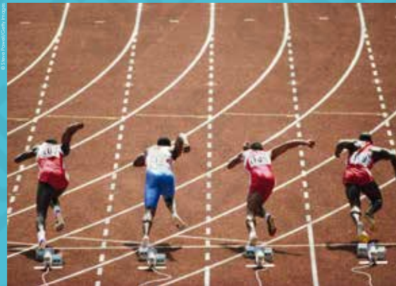
Départ du 100 mètres, Ben Johnson (Canada), Calvin Smith (États-Unis), Linford Christie (Jamaïque) et Carl Lewis (États-Unis) (de droite à gauche), 1988.