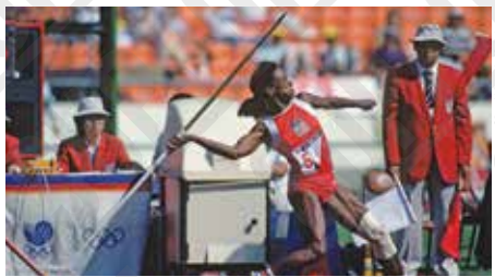
Jackie Joyner-Kersey (États-Unis) au lancer du javelot, 1988.

Héritage de pratiques ancestrales, le lancer du javelot, déjà présent dans les Jeux antiques, est une discipline olympique masculine depuis 1908 et féminine depuis 1932. Il s'agit, en six essais, de propulser le plus loin possible une longue tige surmontée d'une pointe en acier. Entre le premier double vainqueur en 1908 et 1912, le Suédois Eric Lemming (environ 60 mètres) et le Tchèque Jan Zelezny trois fois médaillé d'or entre 1992 et 2000 (plus de 90 mètres) et plus grand lanceur de tous les temps, l'objet et les techniques de lancer, modifiés pour des raisons de sécurité, ont évolué.