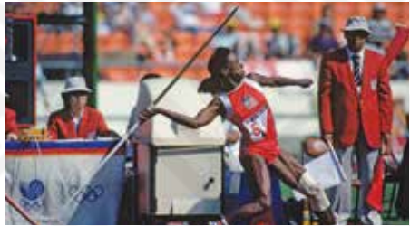
Jackie Joyner-Kersey (États-Unis) au lancer du javelot, 1988.

Héritage de pratiques ancestrales, le lancer du javelot, déjà présent dans les Jeux antiques, est une discipline olympique masculine depuis 1908 et féminine depuis 1932. Il s'agit, en six essais, de propulser le plus loin possible une longue tige surmontée d'une pointe en acier. Entre le premier double vainqueur en 1908 et 1912, le Suédois Eric Lemming (environ 60 mètres) et le Tchèque Jan Zelezny trois fois médaillé d'or entre 1992 et 2000 (plus de 90 mètres) et plus grand lanceur de tous les temps, l'objet et les techniques de lancer, modifiés pour des raisons de sécurité, ont évolué.