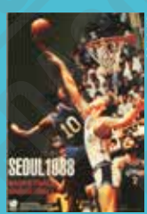
Séoul 1988, Basketball, affiche signée Cho Yong-je, 1988.