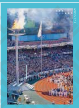
La cérémonie d'ouverture dans le stade olympique, carte postale, 1988.