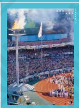
La cérémonie d'ouverture dans le stade olympique, carte postale, 1988.