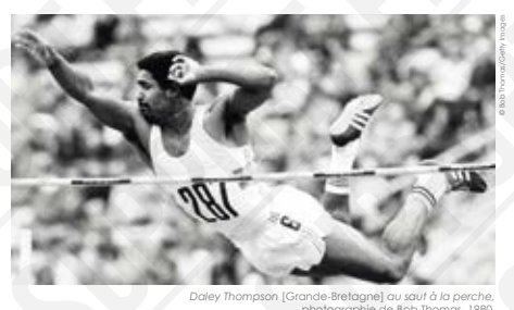
Daley Thompson [Grande-Bretagne] au saut à la perche, 1980.

Pratique gymnique privilégiant la technique, le saut à la perche devient une épreuve des concours athlétiques dans les années 1860 aux États-Unis. Un saut à 3,30 mètres donne la victoire à William Hoyt aux Jeux Olympiques 1896. Après une course d'élan, la réception se fait sur du sable, puis plus tard sur un tapis en mousse. Les records sont tributaires des innovations concernant les techniques de saut et de la technologie des perches. En 1985, Sergueï Bubka sera le premier à franchir une barre à six mètres, cinq ans après les Jeux Olympiques polémiques de 1980.