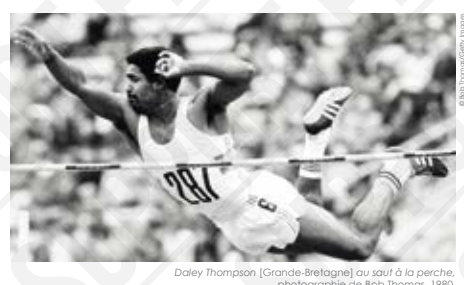
Daley Thompson [Grande-Bretagne] au saut à la perche, 1980.

Pratique gymnique privilégiant la technique, le saut à la perche devient une épreuve des concours athlétiques dans les années 1860 aux États-Unis. Un saut à 3,30 mètres donne la victoire à William Hoyt aux Jeux Olympiques 1896. Après une course d'élan, la réception se fait sur du sable, puis plus tard sur un tapis en mousse. Les records sont tributaires des innovations concernant les techniques de saut et de la technologie des perches. En 1985, Sergueï Bubka sera le premier à franchir une barre à six mètres, cinq ans après les Jeux Olympiques polémiques de 1980.