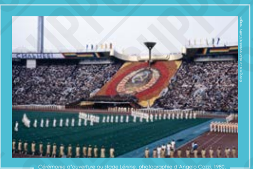
Cérémonie d'ouverture au stade Léline, 1980.