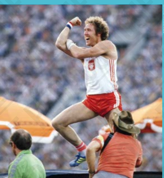
Le bras d'honneur de Władysław Kozakiewicz [Pologne], 1980.

D'abord en bois, puis en bambou et en aluminium, la perche depuis les années 1960 est en fibre de carbone et fibre de verre. Sa longueur n'est pas réglementée : elle mesure aujourd'hui environ 5,20 mètres.