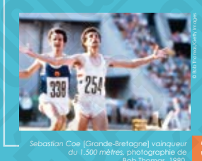
Sebastian Coe [Grande-Bretagne] vainqueur du 1,500 mètres, 1980.

Le boycott réduit la couverture télévisée. Certaines disciplines souffrent de l'absence des plus grands champions. L'URSS conforte sa première place au classement des nations devant la RDA qui confirme sa deuxième place obtenue à Montréal, mais les derniers soubresauts de la Guerre froide planent au-dessus des épreuves.