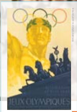
Allemagne, Berlin 1936. Jeux Olympiques, affiche signée Werner Würbel, 1936.