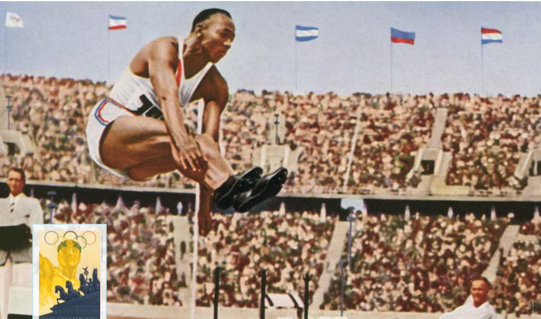
Jesse Owens [États-Unis] au saut en longueur, carte postale colorisée, 1936.