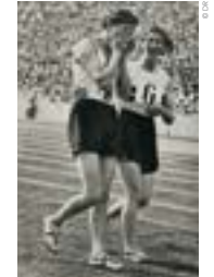
Kälhe Kraus [Allemagne] en pleurs après sa défaite au relais 4x100 mètres, photographie, 1936.