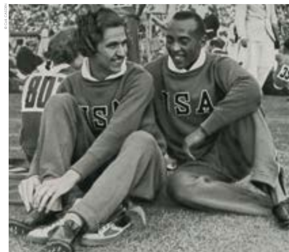
Helen Stephens et Jesse Owens [États-Unis], carte postale, 1936.

« Il voulait que tout le monde soit traité de la même manière et il s'est battu pour ça... »