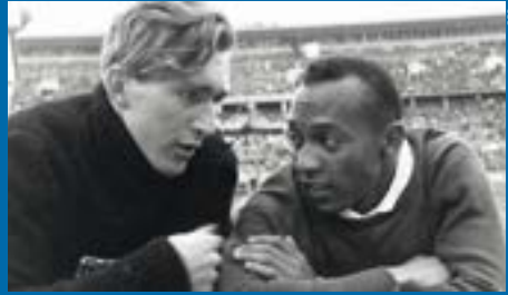
Luz Long [Allemagne] et Jesse Owens [États-Unis] lors des épreuves de saut en longueur, photographie, 1936.

Le saut en longueur avec ou sans élan apparaît dès les Jeux Olympiques en 1900 et constitue une épreuve majeure de l'athlétisme. La longueur minimale de la piste d'élan est de 40 mètres. En 1935, Jesse Owens bat le record du monde (8,13 mètres) qui tiendra jusqu'en 1960. En 1968, Bob Beamon réalise un saut devenu mythique à 8,90 mètres, seulement battu en 1991 par Mike Powell (8,95 mètres), alors face à Carl Lewis, ce dernier détenant le record de médailles d'or (quatre médailles) dans cette discipline.