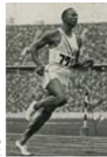
Jesse Owens [États-Unis] lors de l'épreuve du 200 mètres, photographie, 1936.