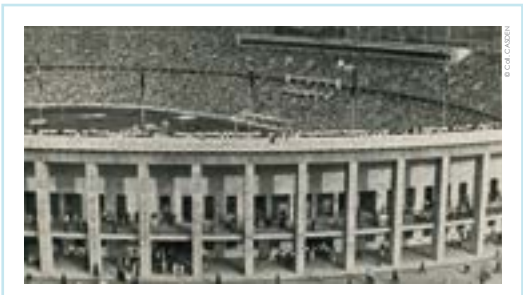
Stade olympique des Jeux Olympiques de Berlin, photographie, 1936.