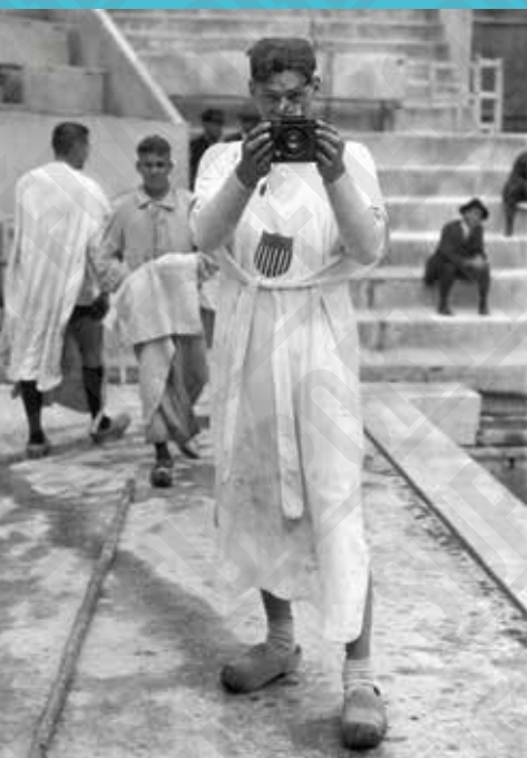
Johnny Weissmuller (États-Unis), photographie de presse, 1924.

Ces Jeux Olympiques, avec 2.954 athlètes hommes et 135 athlètes femmes (4,37 %), sont aussi ceux de la « diversité ». Désormais tous les peuples sont présents, y compris ceux des empires coloniaux. Lors de ces Jeux (les derniers pour le rugby à XV, considéré comme trop violent), l'athlète africain-américain William DeHart Hubbard est médaillé d'or au saut en longueur alors que les États-Unis dominent le palmarès. L'autre star de cette édition est le coureur finlandais Paavo Nurmi qui remporte cinq médailles d'or, aux côtés du nageur Johnny Weissmuller .