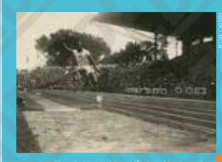
William DeHart Hubbard (États-Unis), champion olympique du saut en longueur, carte-photo, 1924.