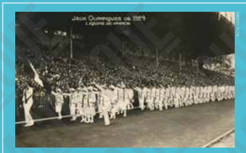
Défilé de l'équipe de France, photographié, 1924.