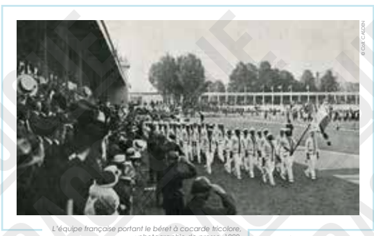
L'équipe française portant le béret à cocarde tricolore, photographie de presse, 1920.