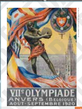
VII e Olympiade, Anvers (Belgique), affiche signée Walter van der Ven & Co, 1920.

INTERDICTION D'IMPRIMER L'EXPOSITION par quelque procédé que ce soit sans l'accord express de la CASDEN.