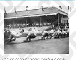
L'équipe anglaise vainqueur du tir à la corde, photographie de l'agence Rol, 1920.