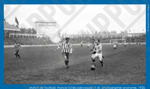
Match de football, France-Tchécoslovaquie (1-4), photographie anonyme, 1920.

Depuis Londres 1908, et contre l'avis de Pierre de Coubertin qui préfère le rugby, les organisateurs des Jeux Olympiques misent sur le football, qui est le sport-roi en Europe et en Amérique latine, pour équilibrer leur budget. La rivalité entre le CIO et la Fédération internationale de football association, née en 1904, conduira à la création de la coupe du monde en 1930. Dans le tournoi olympique de football, les professionnels seront autorisés en 1984, les femmes en 1996, et un âge maximum de 23 ans sera imposé en 1992, permettant à la Fédération internationale de football association de conserver l'exclusivité des matchs internationaux sans limite d'âge.