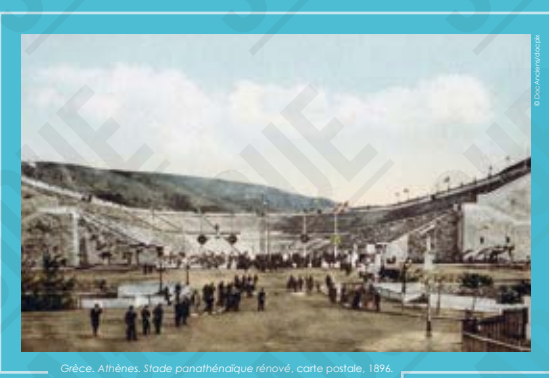
Grèce, Athènes, Stade panathénaique rénové, carte postale, 1896.