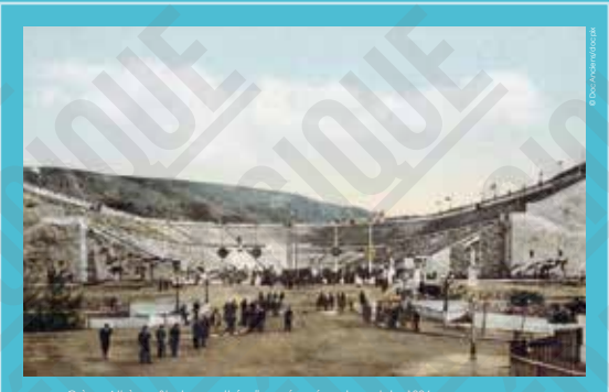
Grèce, Athènes, Stade panathénaique rénové, carte postale, 1896.

Le lancer du disque est une des épreuves pratiquées dans les concours athlétiques de la Grèce antique, plus de 700 ans avant la naissance de Jésus-Christ. Il est remis au goût du jour par les nationalistes grecs dans le cadre des Jeux Zappas qui ont lieu entre 1859 et 1888. Initié au lancer du disque le matin même de l'épreuve, Robert Garrett, de Princeton, l'emporte en 1896 sur ses adversaires grecs qui s'entêtent à imiter les discoboles des vases antiques. Le lancer du disque devient une épreuve olympique féminine en 1928.