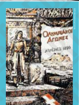
Jeux Olympiques, Athènes 1896, affiche non signée, 1896.