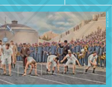
Le départ du 100 mètres en utilisant différentes méthodes, carte postale, 1896.

« Je proclame l'ouverture des premiers Jeux Olympiques internationaux. »