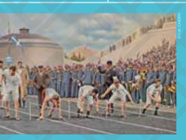
Le départ du 100 mètres en utilisant différentes méthodes, carte postale, 1896.

« Je proclame l'ouverture des premiers Jeux Olympiques internationaux. »