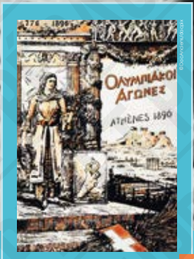
Jeux Olympiques, Athènes 1896, affiche non signée, 1896.

INTERDICTION D'IMPRIMER L'EXPOSITION par quelque procédé que ce soit sans l'accord express de la CASDEN.