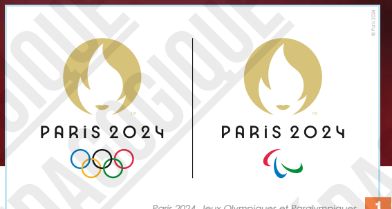
Paris 2024, Jeux Olympiques et Paralympiques, logo officiel, 2019.