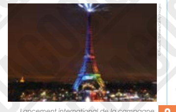
Lancement international de la campagne de candidature de Paris pour accueillir les JOF 2024, photographie de Frederic Stevens, 2017.

C'est aux Jeux Olympiques de 1936 à Berlin que le basketball rejoint le programme officiel des hommes et, 40 ans plus tard, celui des femmes.