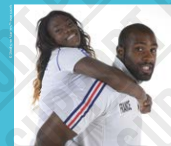
Clarisse Agbegnenou et Teddy Riner (France), médaillés d'or aux championnats du monde de judo, 2014.

Malgré ses deux titres olympiques, Teddy Riner n'a pas connu la victoire pour ses premiers Jeux Olympiques en 2008, remportant une médaille de bronze alors qu'il était champion du monde en titre. Clarisse Agbegnenou, pour ses premiers Jeux Olympiques en 2016, perd en finale alors qu'elle est championne du monde deux ans plus tôt.