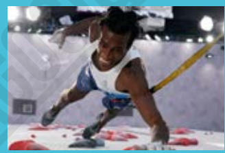
Le grimpeur Mickael Mawem (France) lors de la finale du combiné hommes d'escalade sportive aux Jeux Olympiques de Tokyo 2020, 2021.

Le surf a fait sa première apparition, pour les hommes et les femmes, aux Jeux Olympiques de Tokyo 2020.