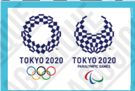
Tokyo 2020, logos officiels d'Asao Tokoro, 2016.