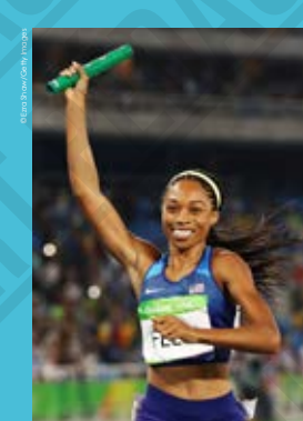
Allyson Felix (États-Unis) après avoir remporté l'or lors du relais 4x400 mètres femmes aux Jeux Olympiques, photographie de Ezo Shaw, 2016.

Allyson Felix remporte l'or aux 4x100 mètres et 4x400 mètres et, en individuel, l'argent sur 400 mètres qui est sa 9 e médaille olympique (elle rejoint alors Merlene Ottey et ses neuf médailles gagnées). Six ans plus tard, elle fait un retour exceptionnel aux Jeux Olympiques de Tokyo 2020 reportés en 2021 et décroche ses 10 e et 11 e médailles. Elle sera ainsi l'athlète féminine la plus décorée de l'histoire olympique, avec onze podiums, dont la première médaille gagnée à Athènes en 2004.