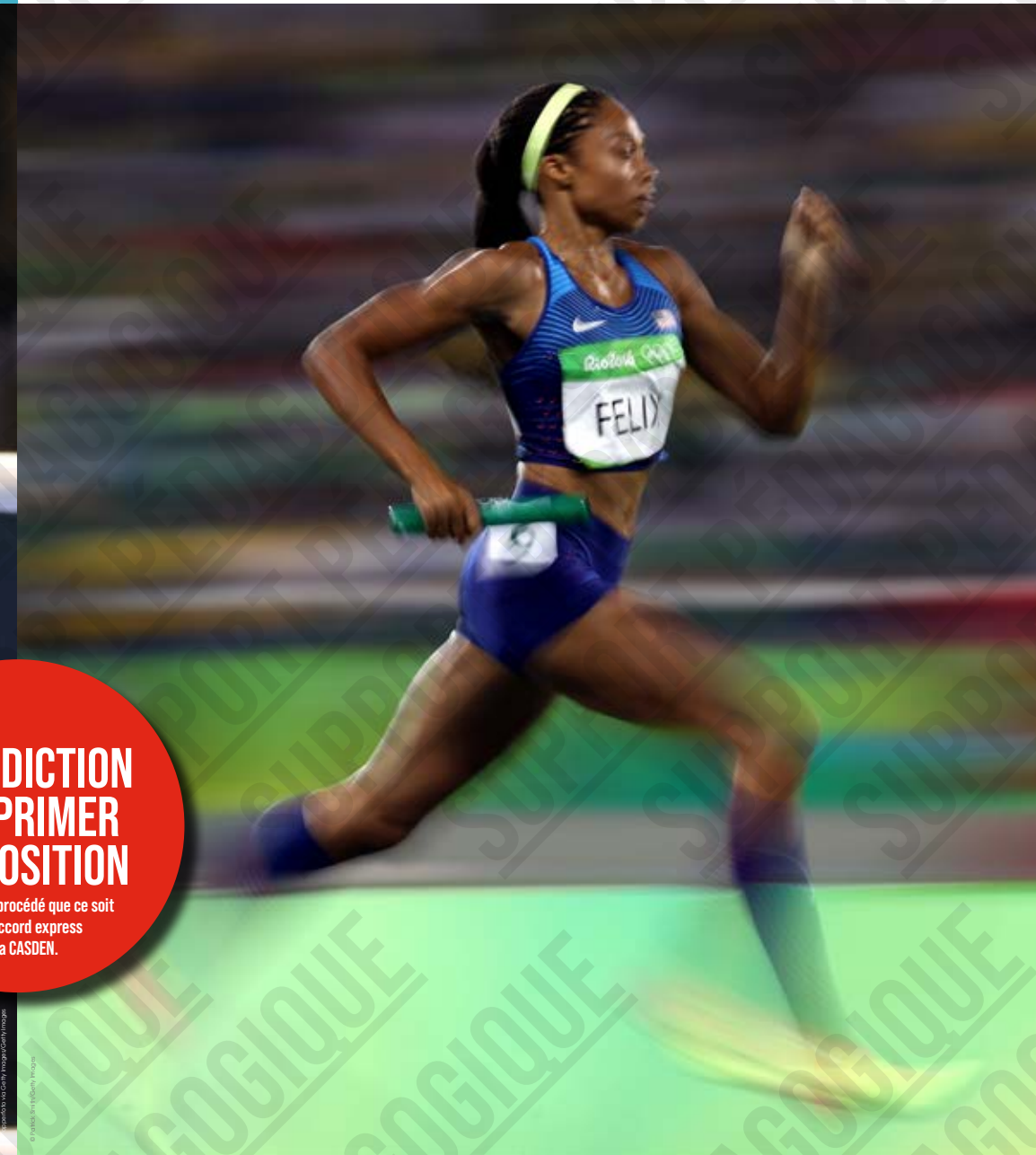
L'Américaine Allyson Felix concourt lors de l'épreuve de relais 4x400 mètres femmes aux Jeux Olympiques, photographie de Patrick Smith, 2016.

par quelque procédé que ce soit sans l'accord express de la CASDEN.