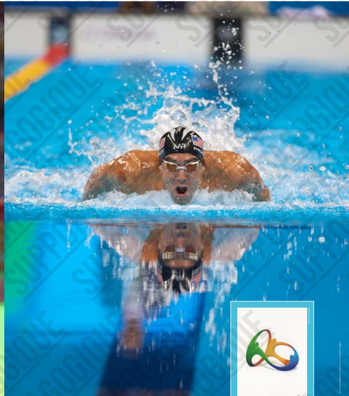
Michael Phelps (États-Unis) en action lors des demi-finales du 100 mètres papillon hommes, photographie de Donald Miralle, 2016.