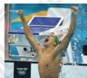
Chad le Clos (Afrique du Sud) victorieux au 200 mètres papillon, photographie de Michael Kappeler, 2012.

Londres est en 2012 la première ville à accueillir les Jeux Olympiques d'été pour la troisième fois dans l'histoire de l'Olympisme. Parmi les 10.568 concurrents, dont 4.676 femmes (44 %), deux sportifs laissent une trace dans les mémoires : le Jamaïcain Usain Bolt , trois fois médaillé d'or sur 100 mètres, 200 mètres et 4x100 mètres (comme à Pékin en 2008), et l'athlète paralympique Oscar Pistorius , appareillé avec des spatules en carbone, qui court le 400 mètres avec les valides.