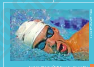
Michael Phelps (États-Unis) au 400 mètres quatre nages masculins, photographie de Dorcas Kralic, 2008.

Le handball à onze est imposé à Berlin en 1936 par l'Allemagne de Hitler, mais c'est un format à sept qui est introduit en 1972 pour les hommes et en 1976 pour les femmes.