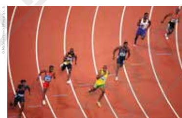
Usain Bolt (Jamaïque) en tête du 200 mètres, photographie de Jérôme Prevost, 2008.

À partir des Jeux Olympiques de Pékin, Usain Bolt règne sans partage sur les épreuves de sprint des championnats du monde : en 2009 à Berlin, 2011 à Daegu, 2013 à Moscou et 2015 à Pékin, totalisant 11 médailles d'or. Seul accroc, une disqualification lors de la finale du 100 mètres à Daegu après avoir provoqué un faux départ. Usain Bolt sera aussi le roi de Londres en 2012 et de Rio de Janeiro en 2016. « L'éclair » rejoint Carl Lewis et Paavo Nurmi au panthéon des nonuples médaillés d'or et des héros du sprint.