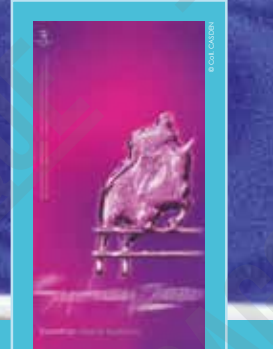
Sydney 2000. Sports équestres, affiche non signée, 2000.