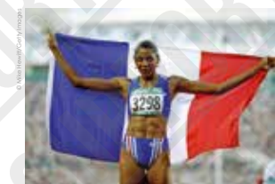
Marie-José Pérec après sa victoire au 400 mètres, 1996.

En 1996, les Jeux Olympiques offrent enfin la possibilité aux femmes de concourir en épée. Cette nouveauté profite à Laura Flessel, âgée de 25 ans, qui monte sur la plus haute marche du podium en individuel et en équipe. Après cette performance, elle se qualifie encore quatre fois aux Jeux Olympiques, remportera trois médailles olympiques et cinq titres mondiaux. En 2012, elle est porte-drapeau de la délégation française pour les Jeux Olympiques de Londres, et s'engage par la suite contre les discriminations dans le sport. Elle a été ministre des Sports en France (2017-2018).