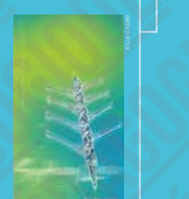
Sydney 2000. Aviron, affiche, 2000.

La cérémonie d'ouverture est un hommage à l'histoire de l'Australie et à la culture aborigène, dont Cathy Freeman est le symbole et l'emblème. Avec ses cinq médailles, la sprinteuse américaine Marion Jones est considérée pendant longtemps comme l'autre héroïne de ces Jeux Olympiques de l'hémisphère sud, avant qu'elle ne soit convaincue de dopage, ce qui l'oblige à restituer ses médailles sept ans plus tard.