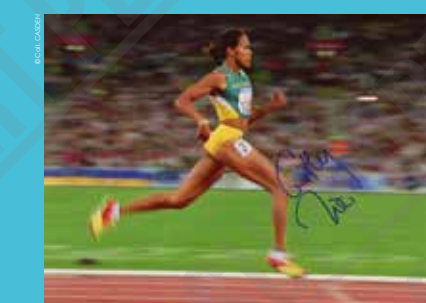
Cathy Freeman (Australie) médaillée d'or au 400 mètres, photographie, 2000.

Symbole vivant des premiers Jeux Olympiques du millénaire mais aussi de la réconciliation nationale, Cathy Freeman n'est pourtant qu'un arbre qui cache le bush. La lente reconnaissance des Aborigènes et les longues négociations entre les dirigeants australiens et le CIO pour l'acceptation des deux drapeaux — australien et aborigène —, noués sur les épaules de l'athlète d'origine aborigène pendant son tour d'honneur, l'attestent.