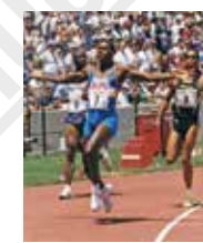
Carl Lewis (États-Unis). La pose du vainqueur, photographie, 1996.

Le choix d'Atlanta, siège de Coca-Cola, pour le centenaire des Jeux Olympiques, à la place d'Athènes, crée la polémique dès 1990. Le rappel de la lutte contre la ségrégation raciale à travers les figures de Martin Luther King ou de Mohamed Ali choisi pour allumer la flamme ne suffit pas à faire oublier les problèmes d'organisation : les transports impossibles, la précarité des volontaires ou l'éviction des sans-abris. En outre, cette olympiade est sous pression après le drame de l'explosion du vol 800 TWA deux jours avant la cérémonie d'ouverture, et l'attaque terroriste contre le village olympique le 27 juillet 1996, qui fait deux morts et 111 blessés.