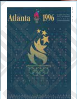
Atlanta 1996. Les Jeux Olympiques du Centenaire, affiche non signée, 1996.

INTERDICTION D'IMPRIMER L'EXPOSITION par quelque procédé que ce soit sans l'accord express de la CASDEN.