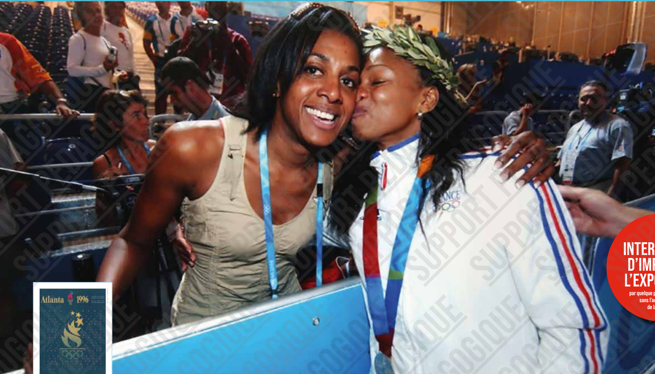
Marie-José Pérec (France), médaillée d'or aux 400 mètres et 200 mètres et Laura Flessel (France), médaillée d'or à l'épée, 1996.