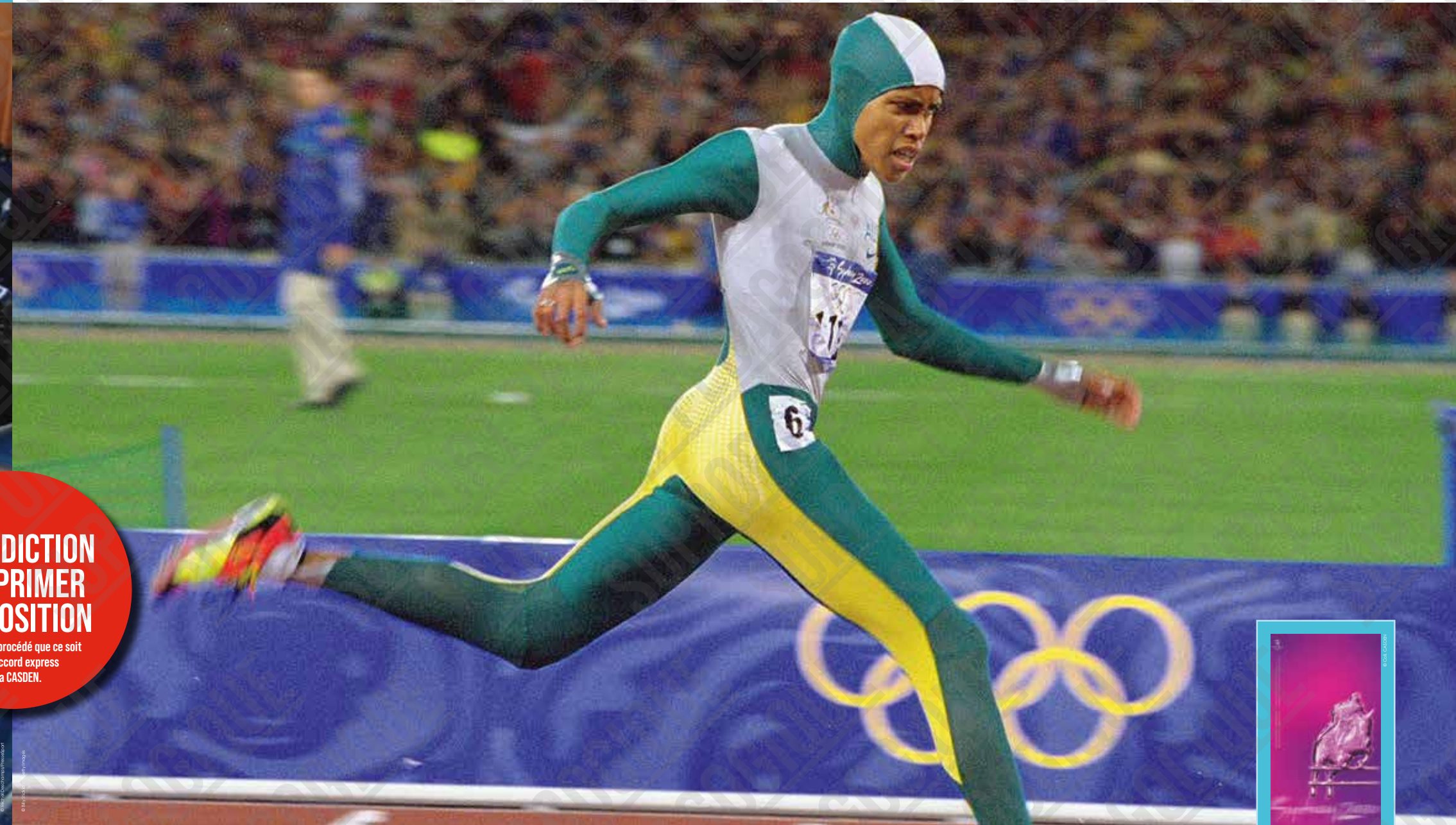
Cathy Freeman (Australie) vainqueur de la finale du 400 mètres, photographie de Billy Stickland, 2000.

INTERDICTION D'IMPRIMER L'EXPOSITION par quelque procédé que ce soit sans l'accord express de la CASDEN.