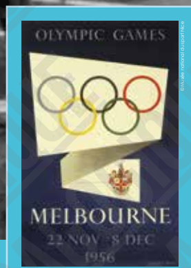
Olympic Games, Melbourne, affiche signée Richard Beck, 1956.

par quelque procédé que ce soit sans l'accord express de la CASDEN.