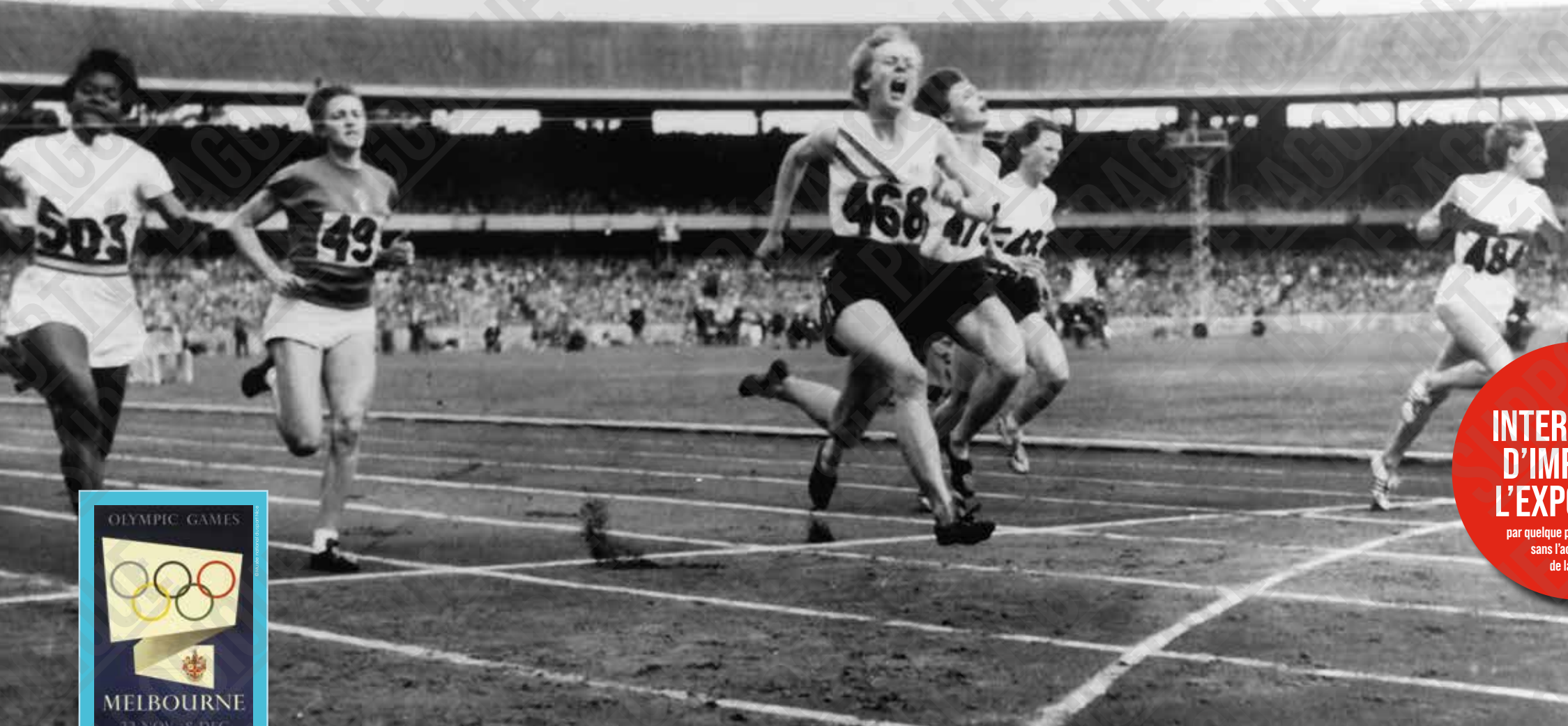
Betty Cuthbert [Australie], vainqueur du 100 mètres, photographie, 1956.

Cathy Freeman, Sydney Morning Herald, 8 août 2017