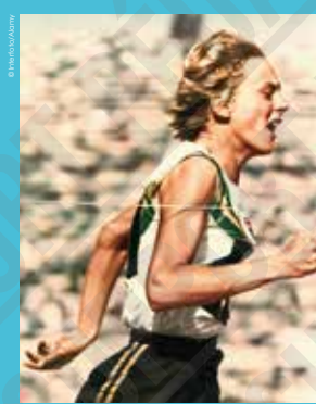
Course de demi-fond, Betty Cuthbert [Australie], photographie, 1956.

Son pays et le monde du sport lui rendent de nombreux hommages : aux Jeux Olympiques de Sydney, en 2000, elle portera la torche olympique en fauteuil roulant et la remettra à Cathy Freeman. En 2012, elle entre dans le prestigieux Hall of Fame de l'IAAF (International Association of Athletics Federations). Jusqu'en 2004, Betty Cuthbert est restée l'Australienne la plus médaillée de l'histoire du pays. Elle décède de sa maladie en 2017.