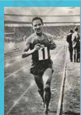
Alan Minshaw [France] champion olympique du marathon, photographie, 1956.