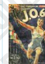
« J.O. 60 », couverture de presse en Les Cahiers de l'Équipe, dessin de Paul Ordner, 1960.

C'est depuis les Jeux Olympiques en 1900 que la voile est présente, pour les hommes comme pour les femmes, et n'a cessé de faire partie des compétitions depuis 1908 sous des formes différentes.