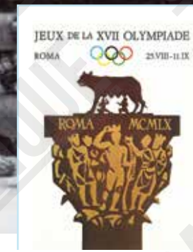
Jeux de la XVII e Olympiade, Rome, affiche signée Armando Testa [reprise sur la couverture du programme], 1960.