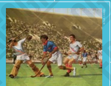
Match de hockey sur gazon, 5 contre 0 par les États-Unis (4-1), carte postale dessinée, 1932.

Si la Grande dépression économique des années 1930 menace gravement la tenue des Jeux Olympiques tout au long de leur préparation, le Comité organisateur réussit néanmoins à faire venir 1.334 athlètes, dont 126 femmes (9,45 %) originaires de 40 pays. Le village olympique permet alors aux athlètes masculins d'être nourris et logés pour seulement deux dollars par jour. Les femmes ne résident pas dans le village olympique, elles habitent temporairement l'hôtel Chapman Park.