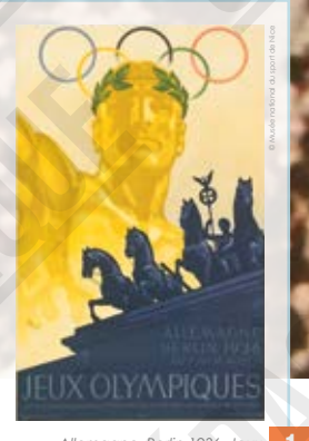
Allemagne, Berlin 1936, Jeux Olympiques, affiche signée Werner Mutschel, 1936.

INTERDICTION D'IMPRIMER L'EXPOSITION par quelque procédé que ce soit sans l'accord express de la CASDEN.