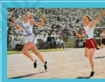
Wilhelmina von Bremen (Allemagne) passe la ligne d'arrivée du 4x100 mètres, carte postale dessinée, 1932.