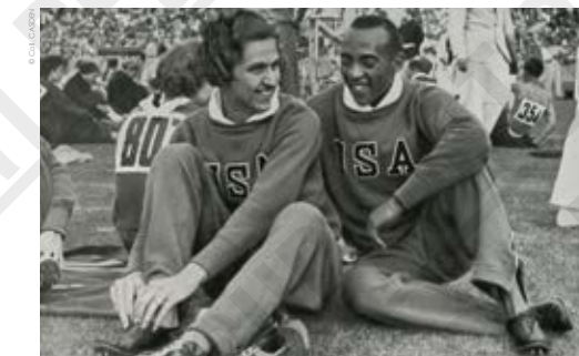
Helen Stephens et Jesse Owens (États-Unis), carte postale, 1936.

Bien que l'Allemagne remporte ces Jeux Olympiques avec 89 médailles, les exploits de Jesse Owens contribuent à ruiner la démonstration, tant espérée par le III e Reich, de la supériorité des athlètes « aryens ». Jesse Owens , victime de la ségrégation en n'ayant aucun droit civique aux États-Unis, contribue à redonner une fierté aux athlètes africains-américains, même si lui-même ne fut jamais un militant actif de la cause des droits civiques. Il meurt en 1980 et son image est restée intacte, le plaçant parmi les plus grands athlètes du XX e siècle.