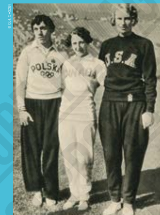
Les femmes les plus rapides du monde : Stella Walsh (Polonoise), Hilda Strick (Canadienne) et Wilhelmina von Bremen (Allemande), carte postale, 1932.

Après les Jeux Olympiques, Judy Guinness remporte par équipe la médaille d'argent aux championnats du monde en 1933, puis la médaille de bronze en 1934, puis se qualifie de nouveau pour les Jeux Olympiques de 1936. À Berlin, ses performances sont mitigées : elle se classe sixième de la compétition olympique.