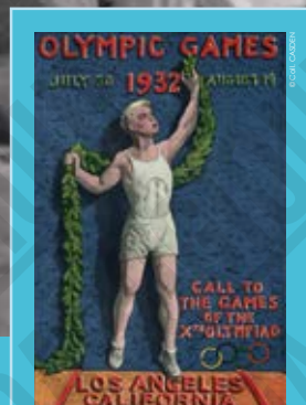
Olympic Games, 1932, Los Angeles, affiche signée Julio Klein (repris en couverture du programme), 1932.