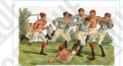
Match de rugby, carte découpée, 1900.

Dans de nombreux sports, des victoires sont remportées par des équipes composées d'athlètes de différentes nationalités et les femmes participent pour la première fois aux jeux modernes. La première « médaillée » de l'histoire – la vainqueur reçoit une couronne d'olivier et une médaille d'argent, la deuxième une médaille de bronze et une couronne de laurier – sera la Britannique Charlotte Cooper au tennis. Chez les hommes, la star de ces Jeux Olympiques est l'athlète étatsunien Alvin Kraenzlein , vainqueur de quatre épreuves d'athlétisme.