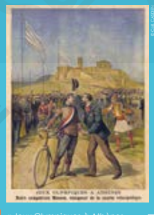
Jeux Olympiques à Athènes. Notre compatriote Masson vainqueur de la course vélocipédique, couverture de presse in Le Petit Journal, 1896.