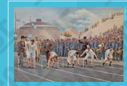
Le départ du 100 mètres en utilisant différentes méthodes, carte postale, 1896.

En 1896, le principe de « championnat du monde » est encore rare et les règles sportives varient d'un pays à l'autre. Ces premiers Jeux Olympiques sont organisés à la Pâque orthodoxe pour le 75 e anniversaire de l'Etat grec moderne né en 1830. Ces premiers Jeux Olympiques sont une réussite pour le roi grec Georges I er qui donne ainsi une image positive de son pays.