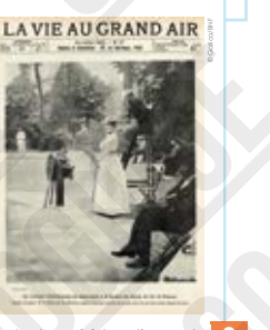
Les tournois internationaux de tennis de la Société des sports de 'Le de Puteaux', couverture de presse d'après un cliché de Tardieu in La Vie au grand air, 1900.