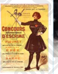
Exposition universelle de 1900. Concours international d'exercices physiques et de sports. affiche signée PAL (Jean de Paléologue), 1900.