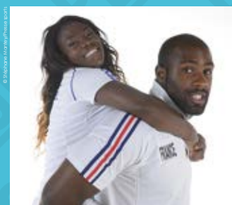
Clarisse Agbegnenou et Teddy Riner [France], médaillés d'or aux championnats du monde de judo, 2014.

Malgré ses deux titres olympiques, Teddy Riner n'a pas connu la victoire pour ses premiers Jeux Olympiques en 2008, remportant une médaille de bronze alors qu'il était champion du monde en titre. Clarisse Agbegnenou , pour ses premiers Jeux Olympiques en 2016, perd en finale alors qu'elle est championne du monde deux ans plus tôt.