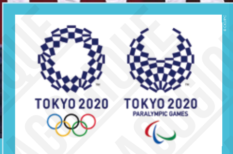
Tokyo 2020, logos officiels d'Asao Tokoro, 2016

INTERDICTION D'IMPRIMER L'EXPOSITION par quelque procédé que ce soit sans l'accord express de la CASDEN.