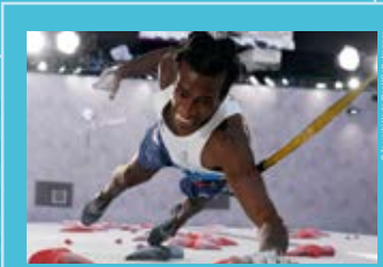
Le grimpeur Mickael Mawem [France] lors de la finale du combiné hommes d'escalade sportive aux Jeux Olympiques de Tokyo 2020, photographie de Tsuyoshi Ueda, 2021.

La mixité des genres a été un axe fort avec de nouvelles épreuves (comme le judo par équipe mixte), que l'on a retrouvé dans la cérémonie d'ouverture, durant laquelle un système de double porte-drapeau (une femme et un homme) a été proposé pour la première fois (pour la France : Clarisse Agbegnenou et Samir Ait Saïd). Avec 48,60 % de femmes, ces Jeux Olympiques sont les plus paritaires de l'Histoire, l'olympiade suivante devra tendre vers la parité complète. Enfin, cinq nouveaux sports ont été au programme au Japon : le baseball-softball, l'escalade indoor, le karaté, le skateboard et le surf.