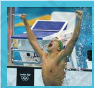
3 Chad le Clos (Afrique du Sud) victorieux au 200 mètres papillon, photographie de Michael Kappeler, 2012.

Londres est en 2012 la première ville à accueillir les Jeux Olympiques d'été pour la troisième fois dans l'histoire de l'Olympisme. Parmi les 10.568 concurrents, dont 4.676 femmes (44 %), deux sportifs laissent une trace dans les mémoires : le Jamaïcain Usain Bolt , trois fois médaillé d'or sur 100 mètres, 200 mètres et 4x100 mètres (comme à Pékin en 2008), et l'athlète paralympique Oscar Pistorius , appareillé avec des spatules en carbone, qui court le 400 mètres avec les valides.