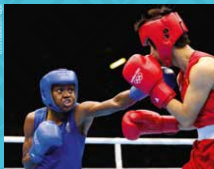
Match de boxe, Nicola Adams contre Ren Cancan [Chine] en catégorie poids mouche, 2012.