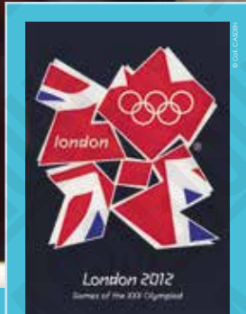
1 London 2012, Games of the XXX Olympiad, affiche, 2012.

INTERDICTION D'IMPRIMER L'EXPOSITION par quelque procédé que ce soit sans l'accord express de la CASDEN.