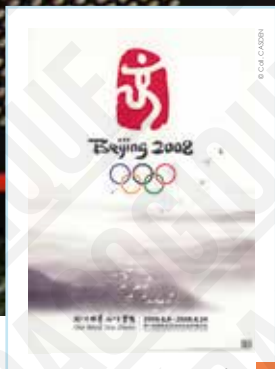
Beijing 2008, affiche signée He Jie, 2008. 1

INTERDICTION D'IMPRIMER L'EXPOSITION par quelque procédé que ce soit sans l'accord express de la CASDEN.