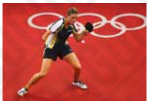
Natalia Partyka (Pologne) au tennis de table, 2008. 3

Le plongeon est devenu un sport olympique en 1904 pour les hommes et en 1912 pour les femmes.