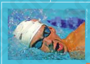
Michael Phelps (États-Unis) au 400 mètres quatre nages individuel, photographie de Donald Miralle, 2004.

Le handball à onze est imposé à Berlin en 1936 par l'Allemagne de Hitler, mais c'est un format à sept qui est introduit en 1972 pour les hommes et en 1976 pour les femmes.