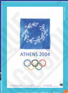
Athènes 2004, affiche, 2004.

par quelque procédé que ce soit sans l'accord express de la CASDEN.