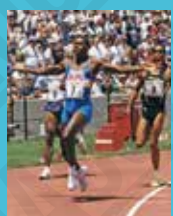
Carl Lewis [États-Unis], la pose du vainqueur, photographie, 1996.

Le cyclisme sur route est de tout temps présent aux Jeux Olympiques (sauf en 1900, 1904, 1908), puis c'est le cyclisme sur piste en 1912. La première apparition des femmes sur piste date de 1988 et, en 1984, pour le cyclisme sur route, peu de temps avant le VTT et le BMX.