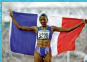
Marie-José Pérec après sa victoire au 400 mètres, 1996.