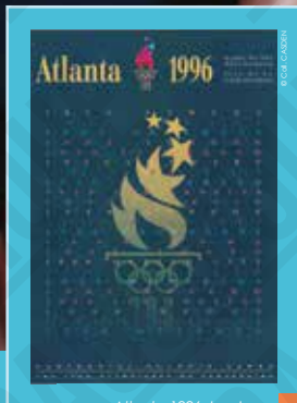
Atlanta 1996. Les Jeux Olympiques du Centenaire, affiche non signée, 1996.

INTERDICTION D'IMPRIMER L'EXPOSITION par quelque procédé que ce soit sans l'accord express de la CASDEN.