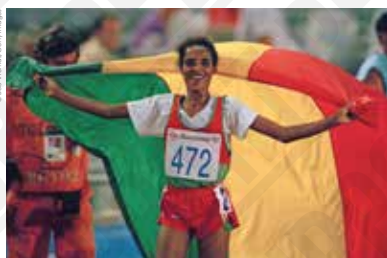
Derartu Tulu [Éthiopie] défilant avec le drapeau de l'Éthiopie après sa victoire, 1992.