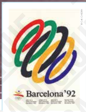
1 Barcelona '92, affiche signée Josep Pla-Narbona, 1992.

INTERDICTION D'IMPRIMER L'EXPOSITION par quelque procédé que ce soit sans l'accord express de la CASDEN.