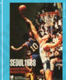
Séoul 1988, Basketball, affiche signée Cho Yong-je, 1988. 3

Le lancer du javelot devient une discipline olympique pour les hommes aux Jeux Olympiques de Londres en 1908. Les femmes participent à cette épreuve depuis les Jeux Olympiques de 1932 à Los Angeles.