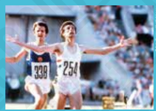
Sebastian Coe [Grande-Bretagne] vainqueur du 1.500 mètres, photographie de Bob Thomas, 1980.

Le saut à la perche fait son apparition aux premiers Jeux Olympiques de 1896. En 2000, plus d'un siècle plus tard, les épreuves féminines sont intégrées.