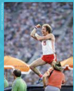
Le bras d'honneur de Władysław Kozakiewicz [Pologne]