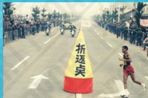
Abebe Bikila [Éthiopie] court le marathon dans les rues de Tokyo, photographie, 1964.