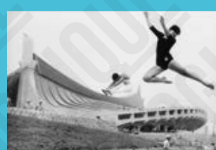
Gymnastes à l'extérieur du nouveau stade olympique, photographie de Lamy Burrows, 1964. 3

C'est depuis les Jeux Olympiques de 1964 que le judo est présent, avant de devenir discipline olympique en 1972. En 1992, l'épreuve féminine fait son apparition.