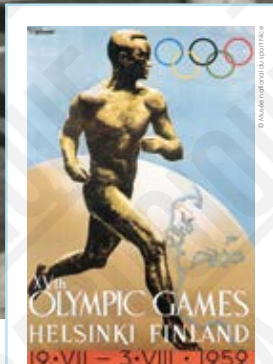
17th Olympic Games, Helsinki Finland, affiche signée Ilmari Sysimetsä, 1952. 1

INTERDICTION D'IMPRIMER L'EXPOSITION par quelque procédé que ce soit sans l'accord express de la CASDEN.