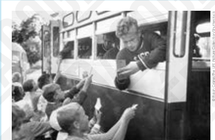
Un rameur russe signe des autographes, photographie de Ralph Crane, 1952. 3