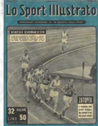
« Emil Zátopek [Tchécoslovaquie] le phénomène de la grande distance : deux médailles d'or, deux records olympiques », couverture de presse in Lo Sport Illustrato, 1952.

La « locomotive tchèque » véhicule aussi la propagande communiste en faveur de la paix et de l'amitié entre les peuples. Bien après la fin de sa carrière aux Jeux Olympiques de Melbourne en 1956 (sixième du marathon), la foule du Printemps de Prague en 1968 le pousse à incarner le mouvement réformateur en Tchécoslovaquie. Il tombe alors en disgrâce avant d'être enfin réhabilité et honoré en 1990, au retour de la démocratie.