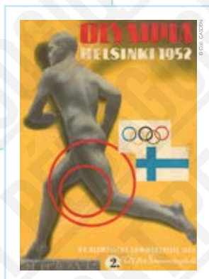
« Helsinki 1952. Paavo Nurmi », couverture de presse in Olympia, 1952.