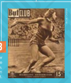
« Micheline Ostermeyer [France] la première championne olympique », couverture de presse in But et Club, 1948. 3

C'est depuis les Jeux Olympiques de 1900 (sauf en 1904) que le water-polo masculin fait partie des épreuves. En 2000, le water-polo féminin fait son apparition.