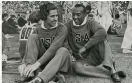
Helen Stephens et Jesse Owens [États-Unis], carte postale, 1936.

Bien que l'Allemagne remporte ces Jeux Olympiques avec 89 médailles, les exploits de Jesse Owens contribuent à ruiner la démonstration, tant espérée par le III e Reich, de la supériorité des athlètes « aryens ». Jesse Owens , victime de la ségrégation en n'ayant aucun droit civique aux États-Unis, contribue à redonner une fierté aux athlètes africains-américains, même si lui-même ne fut jamais un militant actif de la cause des droits civiques. Il meurt en 1980 et son image est restée intacte, le plaçant parmi les plus grands athlètes du XX e siècle.