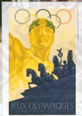
1 Allemagne, Berlin 1936, Jeux Olympiques, affiche signée Werner Würbel, 1936.

INTERDICTION D'IMPRIMER L'EXPOSITION par quelque procédé que ce soit sans l'accord express de la CASDEN.