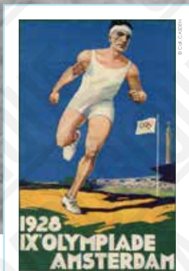
1928. IX e Olympiade. Amsterdam, affiche signée Joseph Rovers, 1928. 1

INTERDICTION D'IMPRIMER L'EXPOSITION par quelque procédé que ce soit sans l'accord express de la CASDEN.