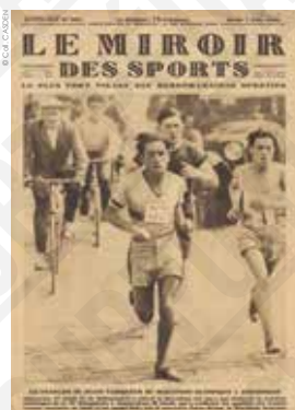
« Le Français El Ouafi vainqueur du marathon olympique à Amsterdam », couverture de presse in Le Miroir des Sports, 1928.

Employé aux usines Renault comme travailleur à la chaîne, Ahmed Boughera El Ouafi n'arrête pas la compétition. À nouveau champion de France en 1927, il connaîtra son heure de gloire aux Jeux Olympiques d'Amsterdam : grâce à une ferme et patiente détermination , le 5 août 1928, il remporte la médaille d'or du marathon.