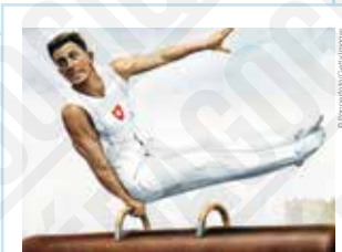
3 Cheval d'arçons. Eugen Mack [Suisse], carte postale dessinée, 1928.