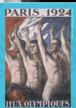
1 Paris 1924, Jeux Olympiques, affiche signée Jean Droit, 1924.