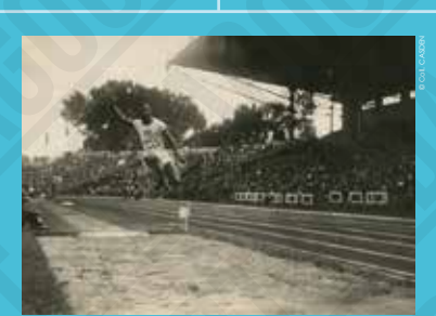
3 William DeHart Hubbard (États-Unis), champion olympique du saut en longueur, carte-photo, 1924.

Ces Jeux Olympiques, avec 2.954 athlètes hommes et 135 athlètes femmes (4,37 %), sont aussi ceux de la « diversité ». Désormais tous les peuples sont présents, y compris ceux des empires coloniaux. Lors de ces Jeux (les derniers pour le rugby à XV, considéré comme trop violent), l'athlète africain-américain William DeHart Hubbard est médaillé d'or au saut en longueur alors que les États-Unis dominent le palmarès. L'autre star de cette édition est le coureur finlandais Paavo Nurmi qui remporte cinq médailles d'or, aux côtés du nageur Johnny Weissmuller .