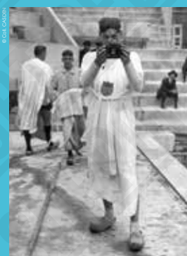
Johnny Weissmuller (États-Unis), photographie de presse, 1924.