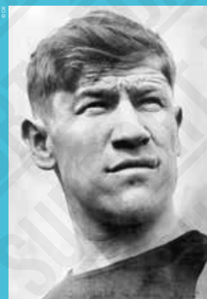
Jim Thorpe [États-Unis], photographie, 1912.

Six mois après sa performance olympique triomphale, sa participation avant les Jeux Olympiques à des matchs de baseball pour quelques dollars est révélée, ce qui enfreint les règles sur l'amateurisme alors en vigueur. Bien que la pratique soit courante, il est disqualifié le 27 janvier 1913 et ses médailles lui sont retirées. Jim Thorpe mène ensuite une brillante carrière sportive dans le football et le baseball jusqu'à la fin des années 1920.