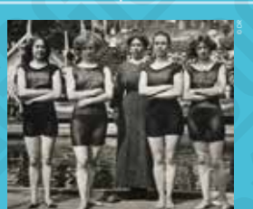
Équipe féminine britannique de natation, gagnante du 400 mètres, photographie anonyme, 1912.

Le pentathlon moderne, la natation féminine, le plongeon féminin et trois nouvelles disciplines équestres font leurs débuts. Marguerite Broquedis , seule représentante féminine française, remporte le titre en tennis et devient la première Française championne olympique, toutes disciplines confondues. Le jeune Hawaïen Duke Kahanamoku fait découvrir au monde une nouvelle nage : le crawl.