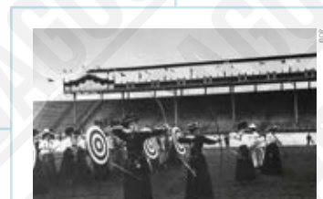
Tir à l'arc féminin, photographie anonyme, 1908.