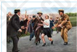
L'arrivée de Dorando Pietri (Italie) au marathon, carte dessinée d'après une photographie de Schimer, 1908.

La longueur de la course du marathon sera fixée suite aux demandes de la famille royale, avec un départ de Windsor et une arrivée face à la loge royale du stade olympique, soit 42,195 kilomètres (distance qui deviendra officielle en 1924). Une délégation conjointe d'Australiens et Néo-Zélandais participe sous la même bannière créée spécialement : celle de l'Australasie.