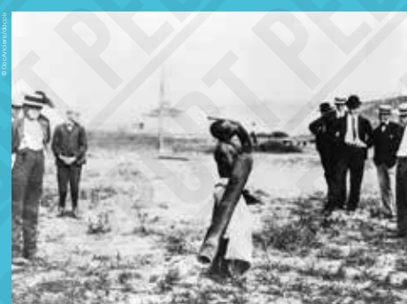
Ota Benga jouant de la trompe traversière, Exposition de Saint-Louis, photographie anonyme, 1904.

Ainsi, des représentants de plusieurs peuples s'affrontent pendant deux journées dans le cadre de disciplines olympiques dont ils ignorent tout. Leurs piètres performances sportives sont raillées, malgré leur dignité surtout lorsque Ota Benga et ses compagnons pygmées succombent à l'un de leurs « passe-temps » : le lancer de boue.