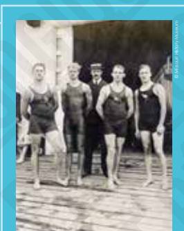
Le New York Athletic Club, l'équipe gagnante au relais en natation, photographie anonyme, 1904.