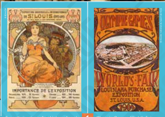
Exposition universelle et internationale de Saint-Louis, affiche signée Alphonse Mucha, 1904.